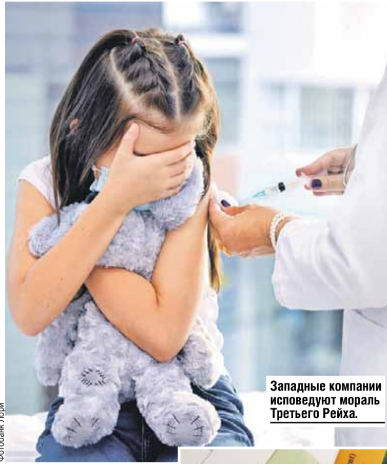
Западные компании исповедуют мораль Третьего Рейха.

- Это бесчеловечно и еще раз указывает на то, что украинский режим имеет тесную связь с нацистами. Именно фашисты в концлагерях проводили жуткие опыты над людьми и детьми в том числе. У тысяч малышей выкачивали кровь, их заражали смертельными болезнями, испытывали на них новые препараты. В печально известном Освенциме страшными экспериментами руководил доктор Менгеле, палач от медицины, который мучил в том числе детей белорусских партизан.