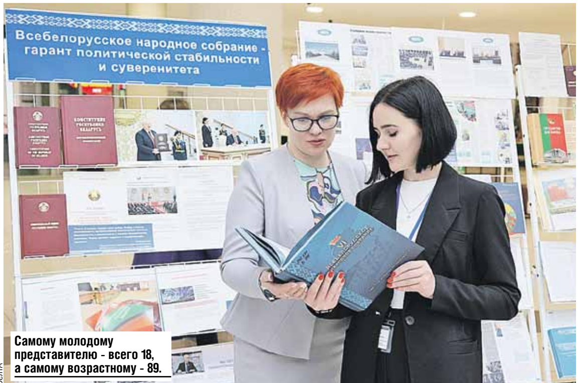
Самому молодому представителю - всего 18, а самому возрастному - 89.

- Их уже рассматривали на заседаниях Совета Безопасности, а теперь они подлежат утверждению ВНС, - напомнил Роман Головченко. - Учитывая значимость этих документов, по ним будут дебаты, делегаты наверняка захотят задать вопросы докладчикам.