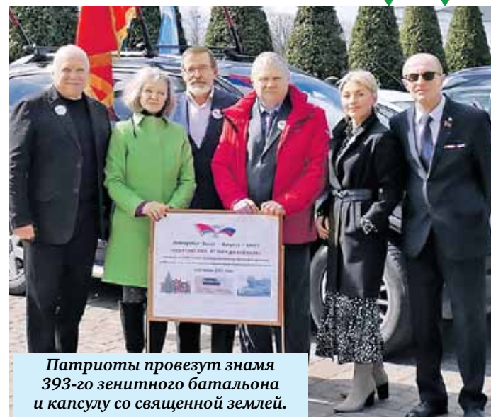
Патриоты провезут знамя 393-го зенитного батальона и капсулу со священной землей.