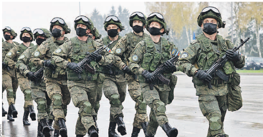
Почти тысяча бойцов из Беларуси, Казахстана, Кыргызстана, Таджикистана и России встали в один строй. Армении пришлось пропустить тренировку.

Командно-штабное учение с миротворческими силами ОДКБ «Нерушимое братство» проводится ежегодно, начиная с 2012 года, на территории одной из стран-участниц организации.