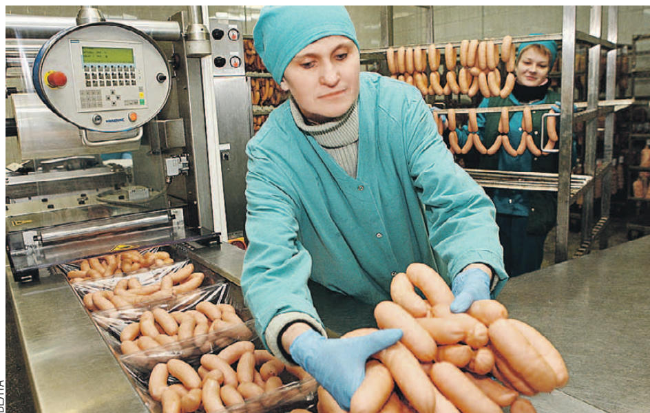
«Сновские» говяжьи сардельки поставляют на стол Президенту Беларуси, а вот в Россию не пускают.

- Мы не только поставляем на российский рынок то, что произвели. Мы делимся технологиями. Но в результате складывается впечатление, что это