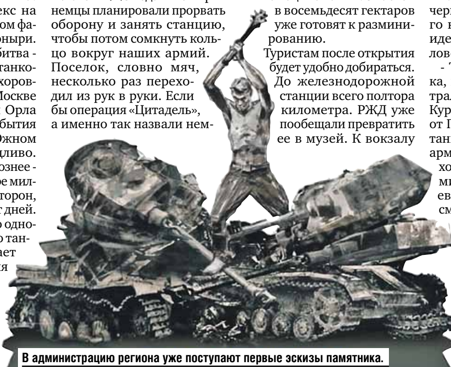
В администрацию региона уже поступают первые эскизы памятника.

Туристам после открытия будет удобно добираться. До железнодорожной станции всего полтора километра. РЖД уже пообещали превратить ее в музей. К вокзалу