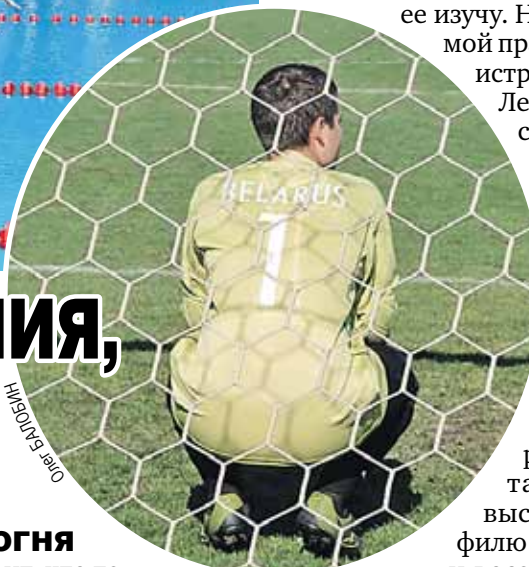
Команды из Витебска и Бреста увезли домой серебряные и бронзовые медали

Тот, кто говорит, что тема Великой Отечественной войны сегодняшней молодежи по барабану, попросту врет. Надо было видеть их, когда они оказались в самом проникновенном месте величественного мемориала - Пантеоне воинской славы. Стояли молча, не шелохнувшись. Пламя Вечного огня дрожало