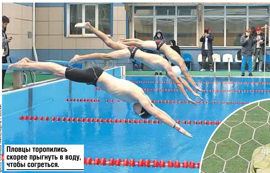
Пловцы торопились скорее прыгнуть в воду, чтобы согреться.

Пандемия, будь она неладна, все же внесла кое-какие коррективы в распорядок спартакиадных мероприятий. Изначально торжественное от-