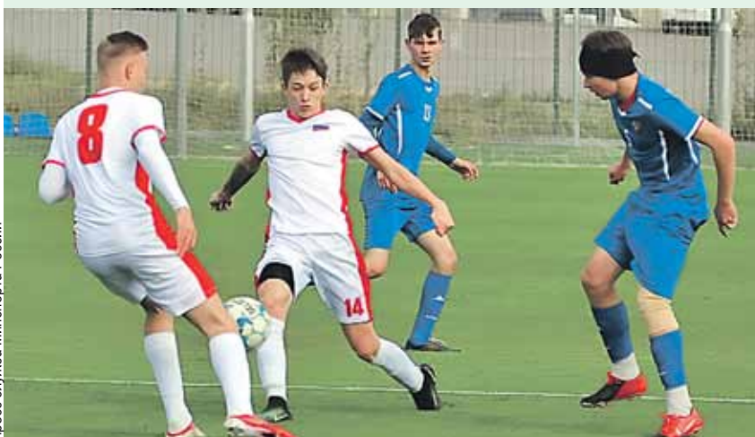
Никто не хотел уступать. Каждый матч проходил в бескомпромиссной борьбе.

Основная задача, которую ставят перед собой организаторы Спартакиады - Постоянный Комитет Союзного государства и Министерства спорта РФ и РБ, - не только спортивные результаты, хотя и они важны для участников. Главное - упрочить связи между народами двух наших стран, сделать так, чтобы молодежь лучше понимала друг друга. Ведь это залог крепкой дружбы наших стран и в будущем.