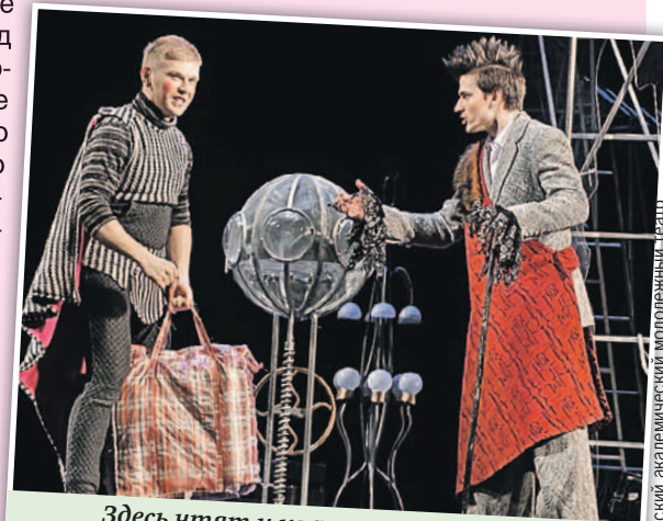
Здесь чтят и классику, и авангард, и жанровые эксперименты.

❖ Где: Ростовский молодежный театр, Площадь Свободы, 3 ❖ Билеты: от 350 рублей.