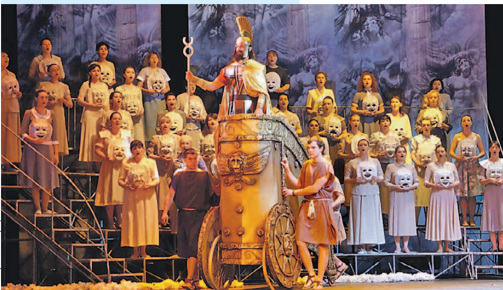
Опера «Орестей» весь сезон собирала аншлаги.

❖ Где: Ростовский театр драмы имени Максима Горького, Театральная площадь, 1 ❖ Билеты: от 200 рублей.