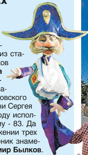
Ростовский государственный театр кукол

Ростов-на-Дону может похвастаться настоящим аксаком российской сцены - Театром кукол. Один из старейших в стране: у его истоков стояли ученики Всеволода Мейерхольда и Константина Станиславского . Он немало младше своего московского собрата - Театра кукол имени Сергея Образцова. Тому в 2018 году исполнится 87 лет, а ростовскому - 83. Да и возглавлял его на протяжении трех с лишним десятилетий ученик знаменитого кукольника - Владимир Былков . Он поставил здесь более 150 спектаклей. Их популярность была такова, что конной милиции приходилось даже разгонять взбудораженную публику. Кредо театра - каждым спектаклем преподавать нравственный урок зрителю. В репертуаре - русские и зарубежные сказки, поучительные истории и притчи. Ну и, конечно, постановки на свою родную, донскую тематику. 15 сентября театр открывает новый сезон премьерой «Маугли». ❖ Где: Театр кукол имени Владимира Быкова, Университетский переулок, 46 ❖ Билеты: от 200 рублей.