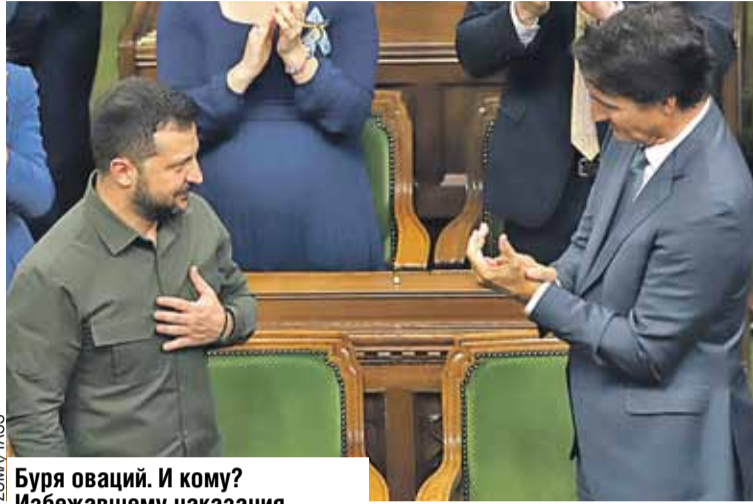
Буря оваций. И кому? Избежавшему наказания эсэсовцу.

Сказки о том, что организаторы не знали, что борец с русскими - эсэсовец, рассказывать можно. Но кто же поверит? Ведь именно Канада собрала у себя девять тысяч (!) сбежавших от Нюрнберга украинских эсэсовцев. Открыто пригрела