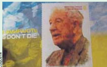
Пока гремел скандал «Укрпшта» в очередной раз подтвердила, что на Украине «нет никаких нацистов», выпустил марку с Хункой.

Выродок Зеленский, громче всех хлопавший земляку-эсэсовцу, так и не открыл свой поганый рот для извинений. Зато спустя