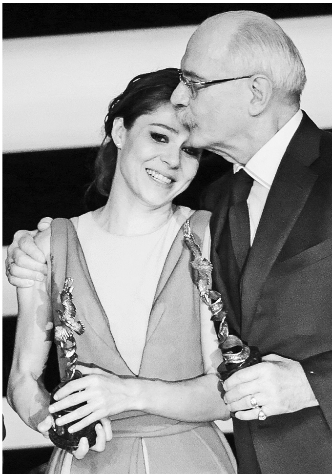
Елена Лядова и Никита Михалков

На XIII церемонии вручения премий российских киноакадемиков лучшим фильмом признан «Солнечный удар» Никиты Михалкова.