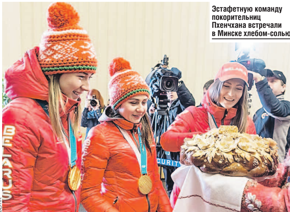
Эстафетную команду покорительниц Пхенчхана встречали в Минске хлеб-солью.

- В начале сезона сама для себя решила, что он будет последним в большом спорте, но после Малого хрустального глобуса и олимпийского