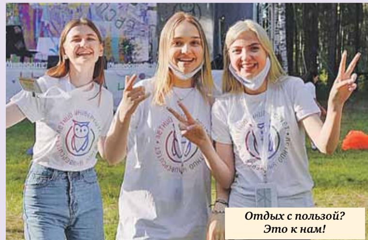
Отдых с пользой? Это к нам!

В 2022 году к «Летнему университету» присоединятся педагогические вузы.