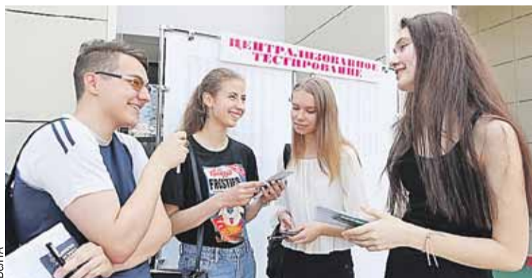
Ну что, девочки, айда в МГУ.