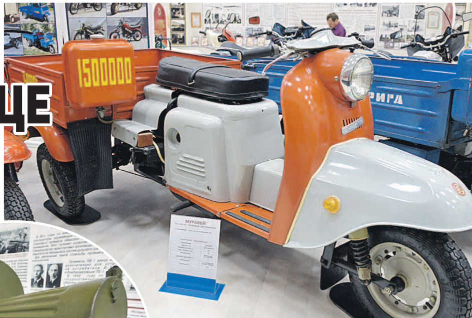
На «Тулмашзаводе» всегда работали мастера на все руки: могли собрать как легендарный пулемет «Максим», так и мотороллер «Муравей» для доставки хлеба и мороженого.

Изначально скульптура Левши даже находилась во дворе завода. Но в 2009-м памятник перенесли на набережную реки Упы, недалеко от въезда в город, для того чтобы с символом тульских мастеров могли познакомиться и гости города.