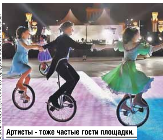
Артисты - тоже частые гости площадки.