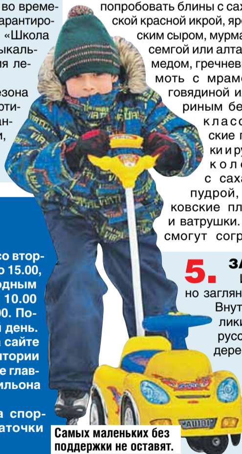
Самых маленьких без поддержки не оставят.