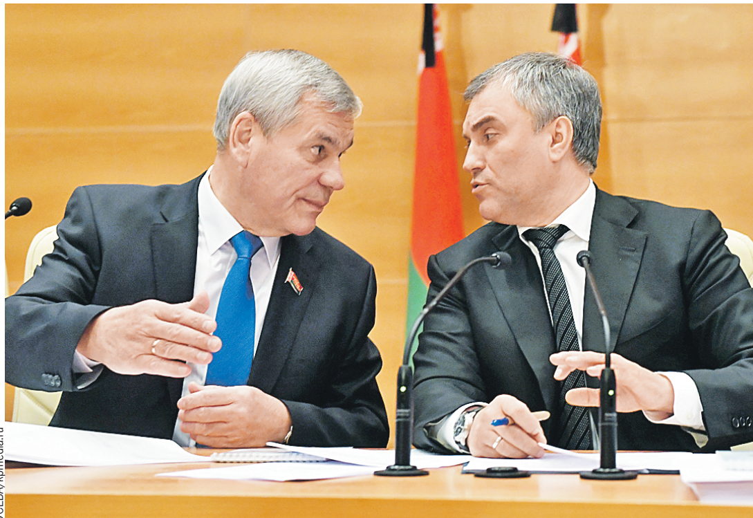
Председатель Парламентского Собрания Вячеслав Володин (справа) и его первый заместитель Владимир Андрейченко договорились, что Парламентское Собрание будет больше внимания уделять реализации союзных программ и контролю за выполнением принимаемых решений.

- Спасибо за доверие, постараюсь его оправдать, - обратился к коллегам Володин. - Буду делать все для того, чтобы наши отношения в рамках Союза развивались, чтобы парламент Беларуси и России как можно эффективнее решал задачи гармонизации и унификации законодательства.