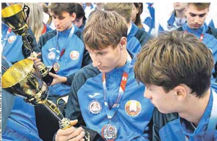
Спартакиада СГ для детей и юношества - трамплин на серьезные турниры.

Так получается, что белорусы в Россию заглядывают все-таки чаще. И приезжают не просто участвовать, а побеждать. Уже не раз и не два они щелкали россиян по носу в их же родных стенах, забирая главные призы. Например, начался нынешний год