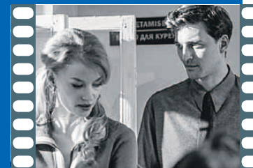
«Конец прекрасной эпохи»