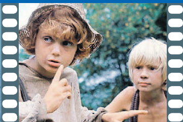
«Приключения Тома Сойера и Гекльберри Финна»