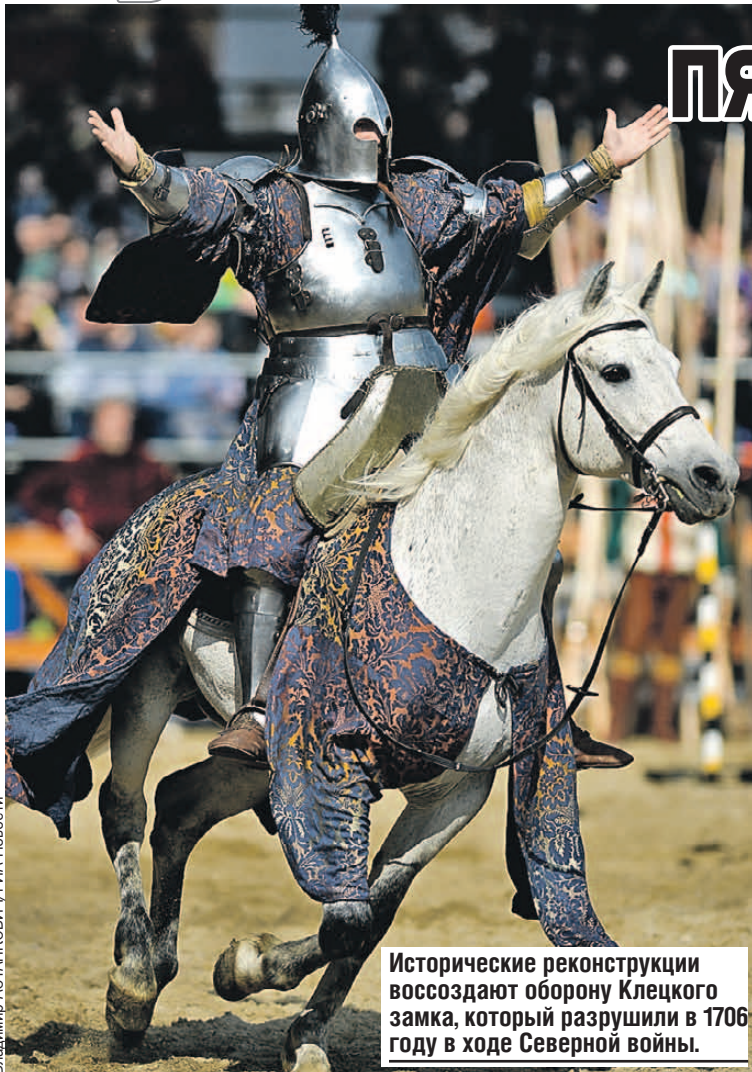
Исторические реконструкции воссоздают оборону Клецкого замка, который разрушили в 1706 году в ходе Северной войны.