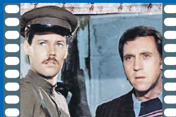
«Место встречи изменить нельзя»