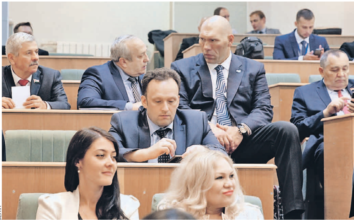
Николай Валуев (в центре) уже привык, что залы заседаний обычно не приспособлены к его габаритам. Но это не мешает плодотворной работе, сенатор Франц Клинцевич (по правую руку) подтвердит.