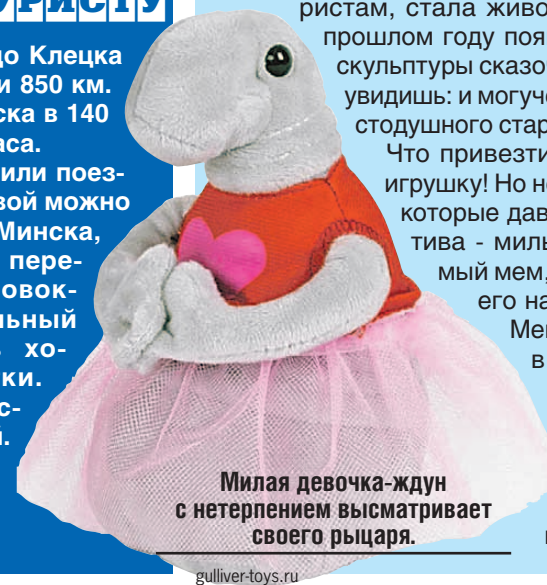
Милая девочка-ждун с нетерпением высматривает своего рыцаря.