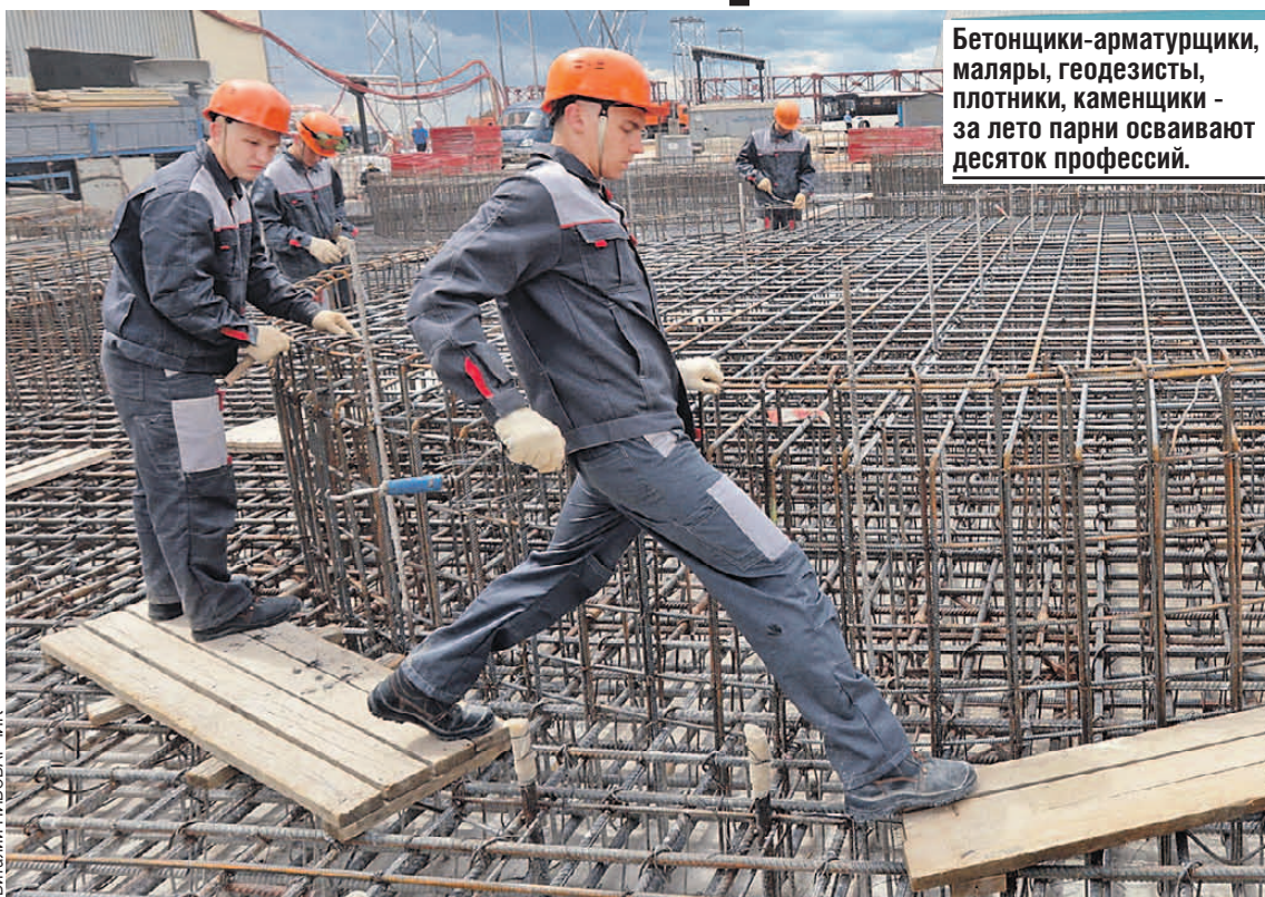
Бетонщики-арматурщики, маляры, геодезисты, плотники, каменщики - за лето парни осваивают десяток профессий.