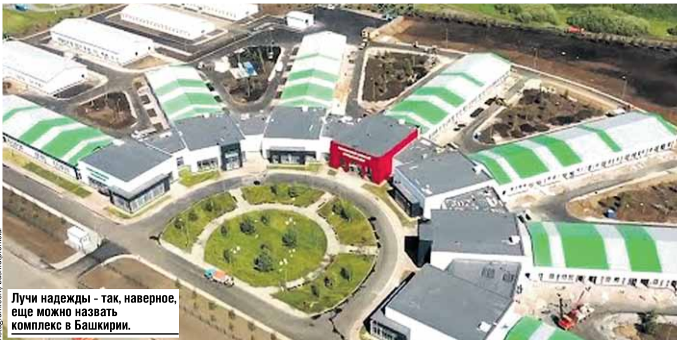
Лучи надежды - так, наверное, еще можно назвать комплекс в Башкирии.