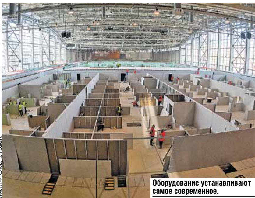
Оборудование устанавливают самое современное.