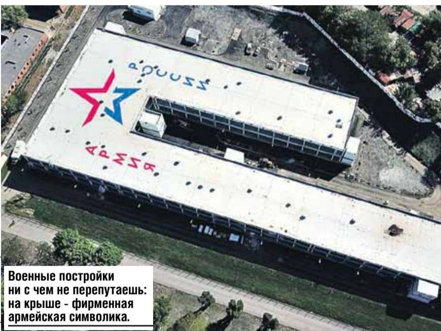
Военные постройки ни с чем не перепутаешь: на крыше - фирменная армейская символика.

Госпитали в принципе все однотипные, например, каждая палата в реанимации оборудована аппаратом ИВЛ. Но это только внешнее впечатление. Каждый из них строился с учетом местных особенностей. Так, в Пушкине вокруг здания больницы установили специальную дренажную систему на случай наводнения, укрепили грунт. По словам военных, такой корпус простоят теперь хоть сотню лет. А работать он будет и после окончания пандемии в отличие от клиник в том же Ухане. При этом всего за сутки его можно из инфекционного госпиталя перепрофилировать в хирургическое отделение: все оборудование для этого есть. А на Камчатке фундамент «военной» клиники сделали так, что здание выдержит даже девятибалльное землетрясение.