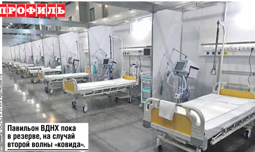
Павильон ВДНХ пока в резерве, на случай второй волны «ковида».