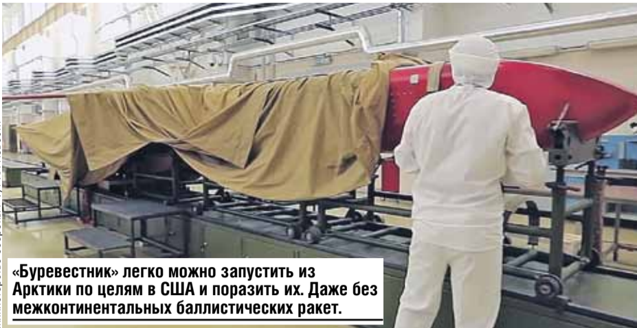
«Буревестник» легко можно запустить из Арктики по целям в США и поразить их. Даже без межконтинентальных баллистических ракет.