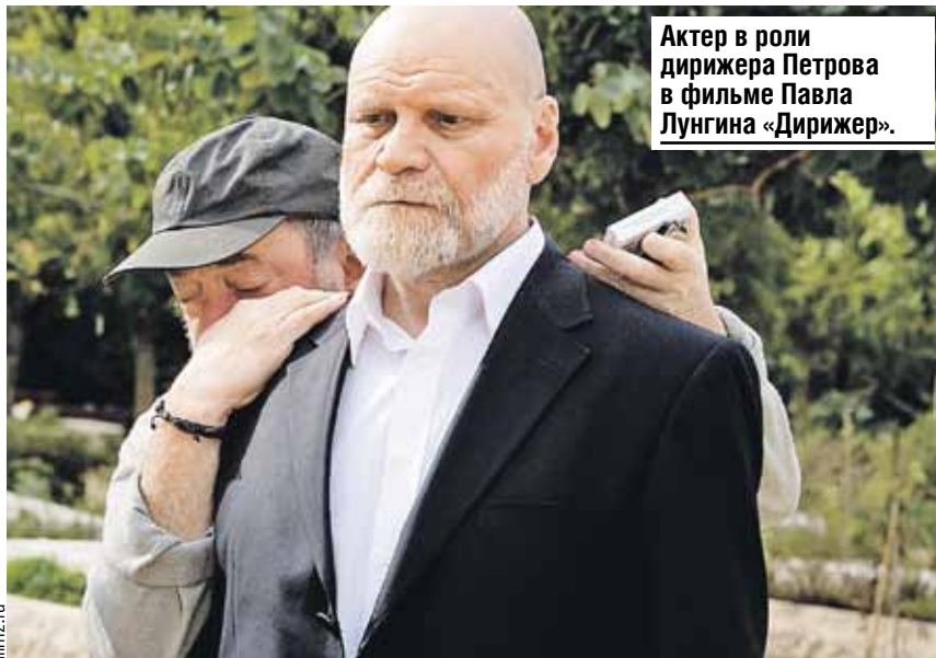
Актер в роли дирижера Петрова в фильме Павла Лунгина «Дирижер».