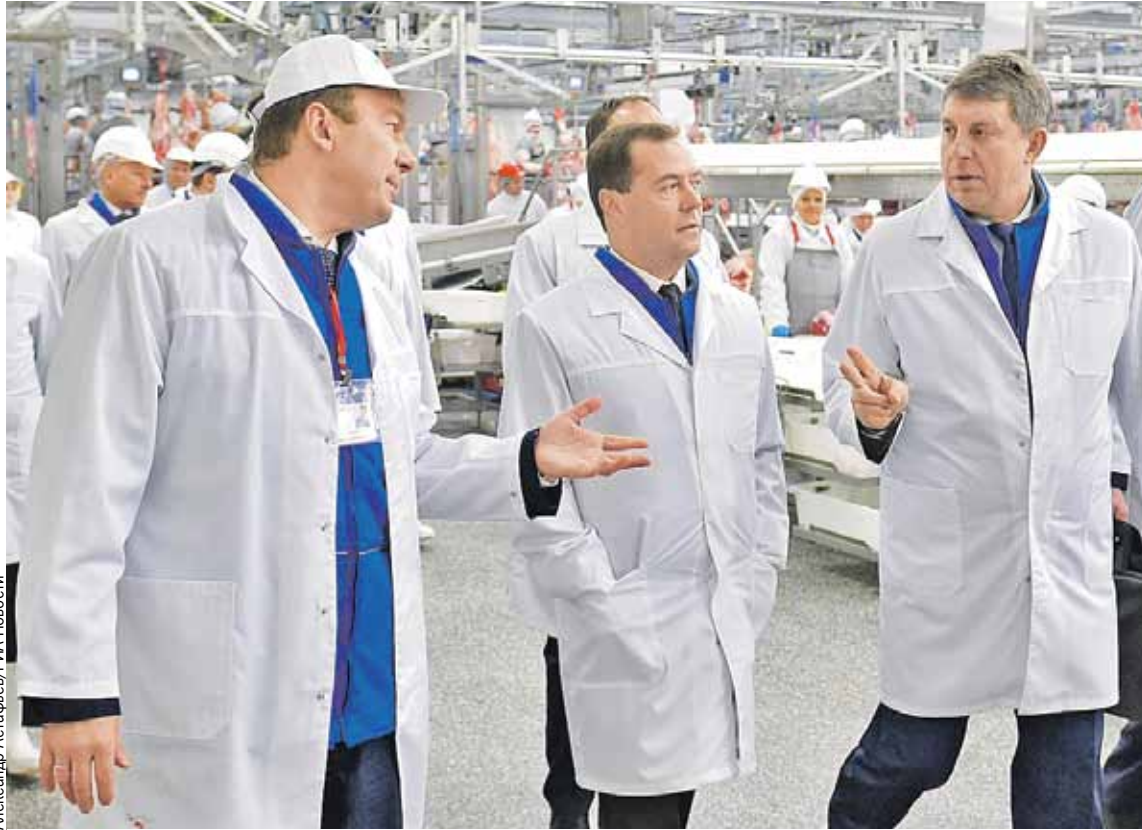
Александр Богомаз (крайний справа) и глава холдинга «Мираторг» Виктор Линник показывают премьер-министру Дмитрию Медведеву новые корпуса компании в деревне Хмелево.

Товарооборот между Брянщиной и Беларусью 2009 г. - $400 миллионов 2014 г. - $807 миллионов