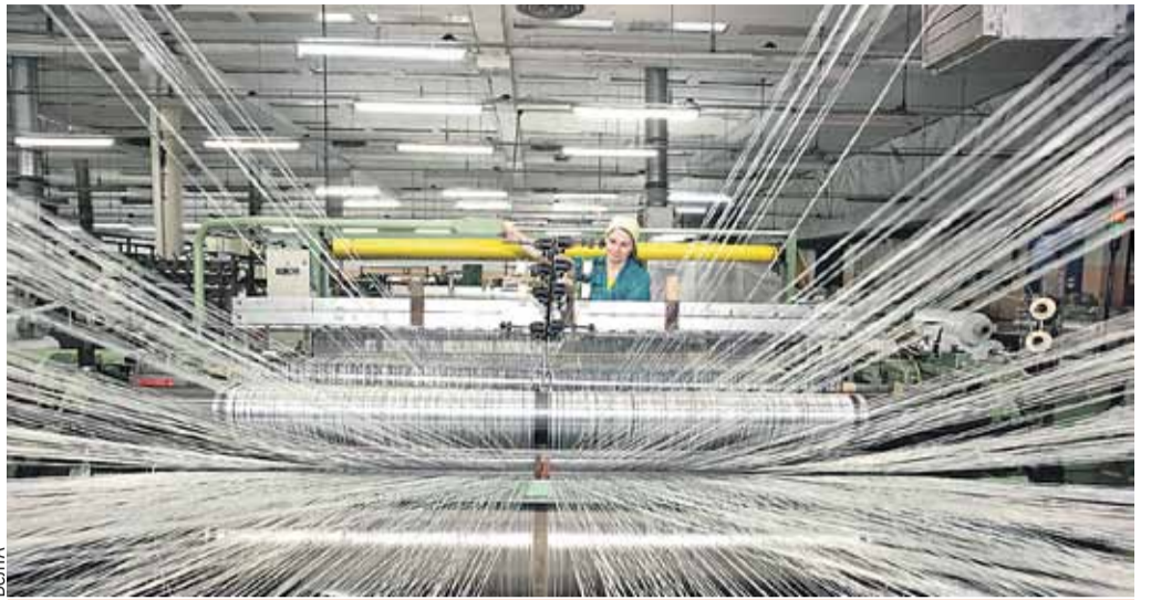
В прошлом году Полоцкий завод «Стекловолокно» отметили наградой за достигнутый финансовый результат.

Вузы Могилевской области и России подписали больше сотни документов о сотрудничестве. Их основные направления - научно-образовательные проекты, стажировки, повышение квалификации преподавателей и студентов, издание учебных пособий.