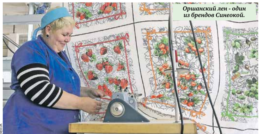
Оршанский лен - один из брендов Синеокой.

- Любой кризис становится проблемой для слабого. Для сильного же это возможности для налаживания производства новых видов продукции для новых рынков сбыта. Страны, которые ввели санкции, вредят самим себе. То, что раньше покупали, - произведем сами. А остальное у нас и так есть, - считает губернатор Брянской области Александр Богомаз.