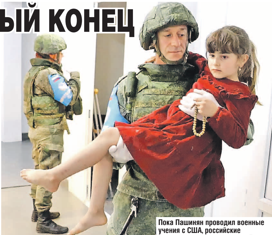
Пока Пашинян проводил военные учения с США, российские миротворцы спасали жителей Нагорного Карабаха.

Все радикально поменялось в 2020 году, когда война вспыхнула вновь. Нефтеносный Баку сумел за эти годы создать более сильную армию, чем у соседа, оснатив ее самым современным оружием. Однако вмешательство России удержало тогда Армению