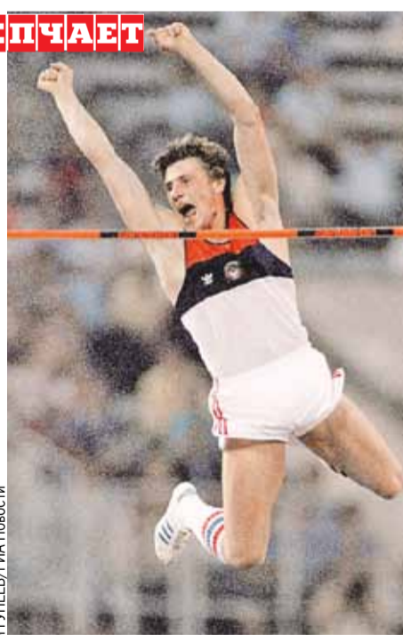
Звездное прошлое не спасает от кошмарного настоящего.

Что же стало поводом для атаки? Ведь он неоднократно выступал с призывами не допускать российских и белорусских спортсменов к международным соревнованиям из-за СВО. И не далее как в августе этого года поддержал решение совета Международной федерации легкой атлетики продлить бан для представителей РФ и РБ. Более того, уроженец Луганска, позже, еще в советское время переехавший в Донецк,