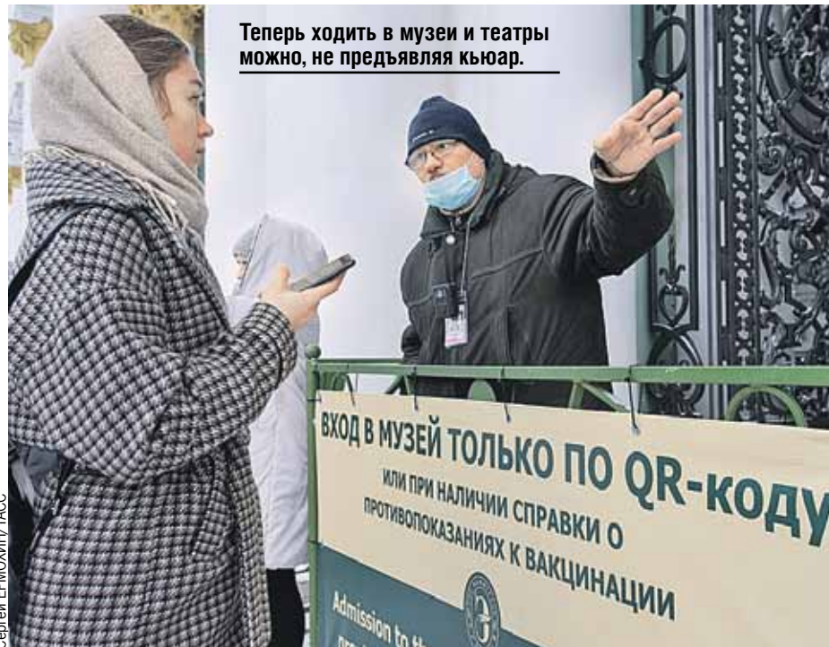
Теперь ходить в музеи и театры можно, не предъявляя кьюар.

Как и ожидалось, послабления принес «омикрон». Крайне заразный штамм переносится намного легче, не создавая такой нагрузки на систему здравоохранения, которая была в первые волны пандемии. В итоге, несмотря на немаленькое в абсолютных цифрах количество заболевших, ограничения постепенно