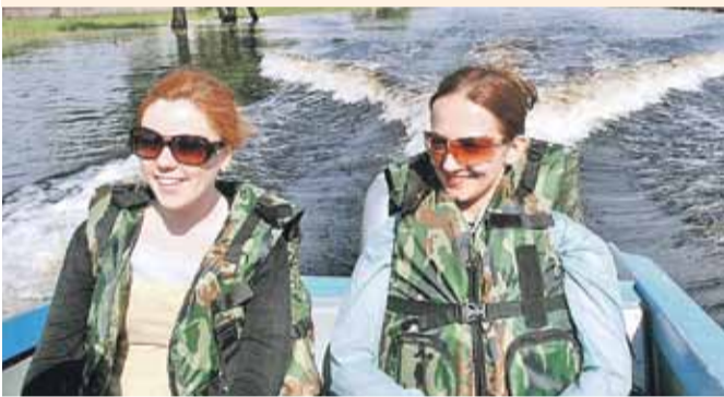
Однодневный сплав по притокам Припяти обойдется в две тысячи российских рублей на человека.

Чтобы испытать максимальное единение с природой, лучше всего исследовать Припять с воды. Байдарки и лодки в аренду - не проблема. Организуют водные туры даже прямиком из Минска. И надо сказать, что популярность у них огромная. Ведь сейчас река разлилась и превратила все окрестности в сплошную водную гладь: дна не видно даже в ясную погоду! Кстати, если верить картам древнегреческого историка Геродота, именно в районе современного Полесья когда-то находилось настоящее море.