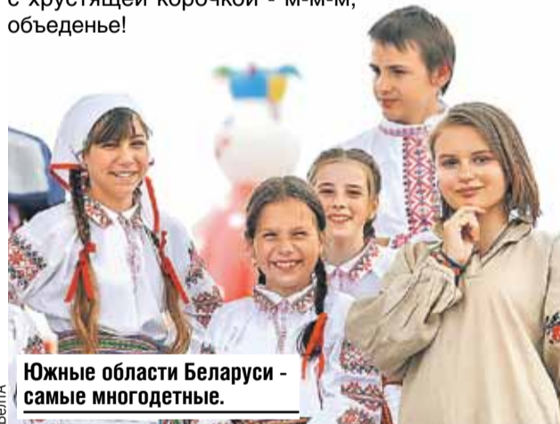
Южные области Беларуси - самые многодетные.

Полесье - особая болотная республика внутри Беларуси со своими традициями, кухней и даже языком. В каждом селе свой диалект, который порой понятен только самим местным. Но слушать их - одно удовольствие! Да еще и за столом с дивными полесскими яствами. Ароматные караваи, наваристые супы, маханка с пышными блинцами («блины» тут не говорят), вареники с черникой и налистники с творогом. Во многих деревнях отопление давно газовое, но печки никто разрушать не спешит. Ведь именно в чугушке получается самая вкусная картофельная бабка с хрустящей корочкой - м-м-м, объедаешь!