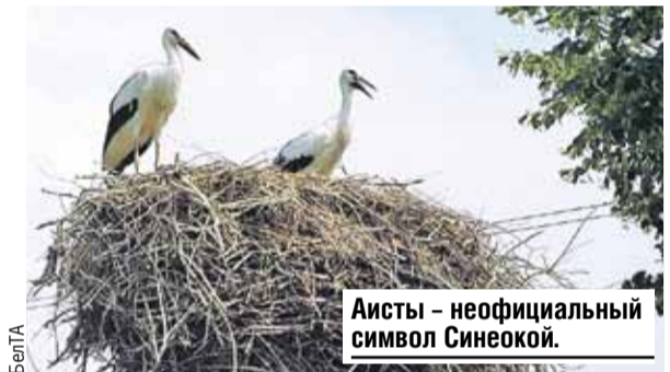
Аисты - неофициальный символ Синеокой.