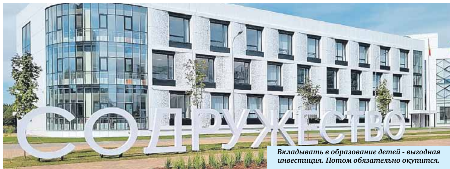
Вкладывать в образование детей - выгодная инвестиция. Потом обязательно окупится.