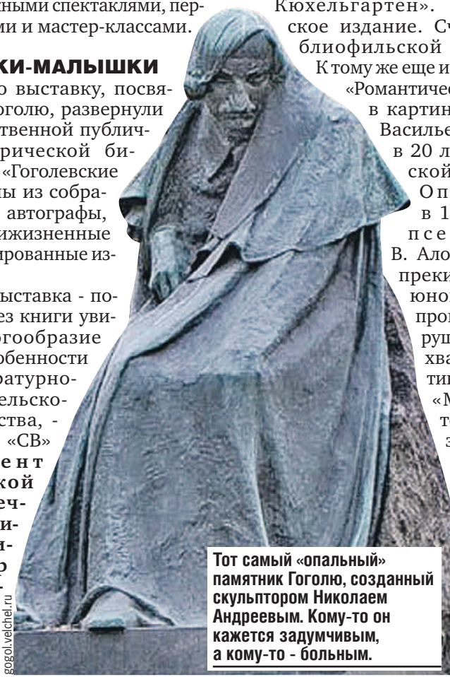
Тот самый «опальный» памятник Гоголю, созданный скульптором Николаем Андреевым. Кому-то он кажется задумчивым, а кому-то - больным.

До революции было известно всего четыре экземпляра книги, - продолжает Людмила Ларионова. - Сейчас они стоят очень и очень дорого и находятся у частных коллекционеров.