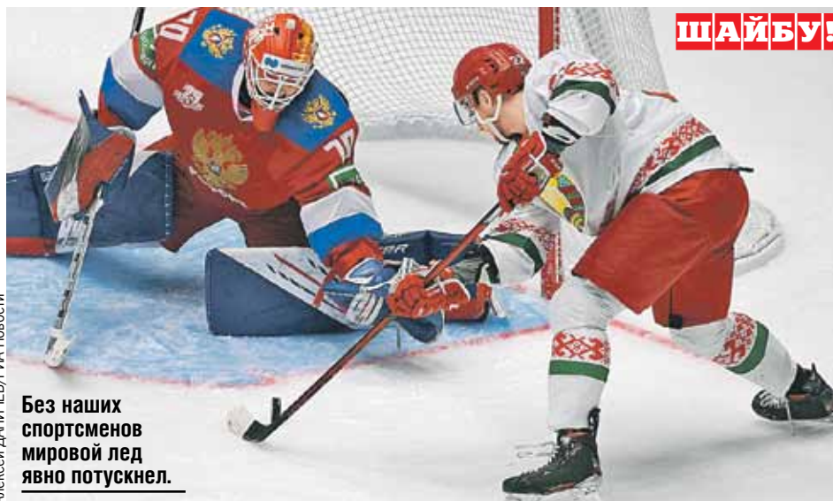
Без наших спортсменов мировой лед явно потускнел.

Вердикт конгресса ИИХФ в Федерации хоккея России отказались коммен-