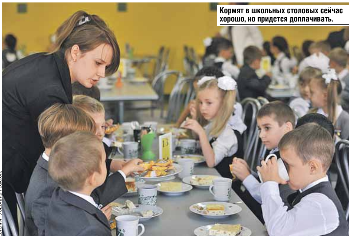
Кормят в школьных столовых сейчас хорошо, но придется доплачивать.

ным), а некоторые юбочки из макси стали мини. Обувь тоже