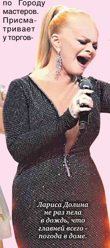
Лариса Долина не раз пела в дождь, что главнее всего - погода в доме.