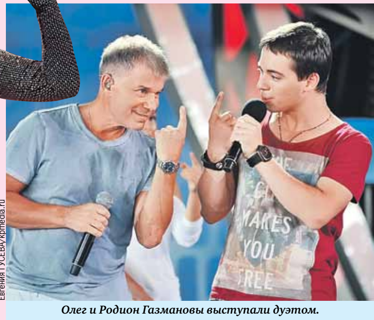
Олег и Родион Газмановы выступали дуэтом.