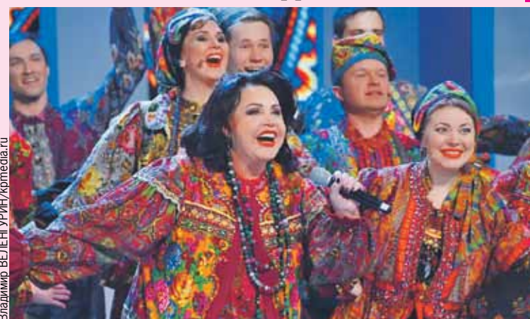
Надежда Бабкина не пропустила практически ни одного «Базара».

❖ На самом первом фестивале выступала харизматичная Надежда Бабкина . В 2001 году на белорусской сцене и вовсе