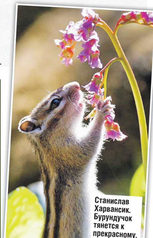
Станислав Харванск. Бурундучок тянется к прекрасному.