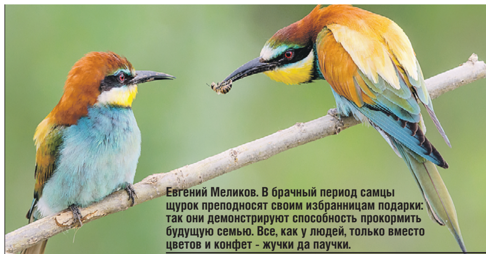
Евгений Меликов. В брачный период самцы щурок преподносят своим избранницам подарки: так они демонстрируют способность прокормить будущую семью. Все, как у людей, только вместо цветов и конфет - жучки да паучки.