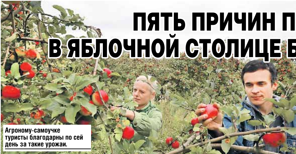
Агроному-самоучке туристы благодарны по сей день за такие урожаи.