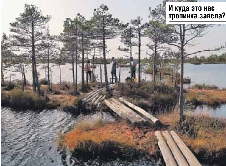
И куда это нас тропинка завела?

В Ельне активно развивается самое популярное направление экологического туризма - бердвотчинг, или наблюдение за птицами. Как раз в это время над живописными озерами с островками причудливых форм парят стаи серых журавлей. В объектив самых удачливых туристов нередко попадают и места гнездования редких пернатых: белой куропатки и орлана-белохвоста.