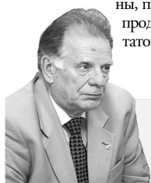
Жорес АЛФЕРОВ, вице-президент Российской академии наук, лауреат Нобелевской премии по физике: