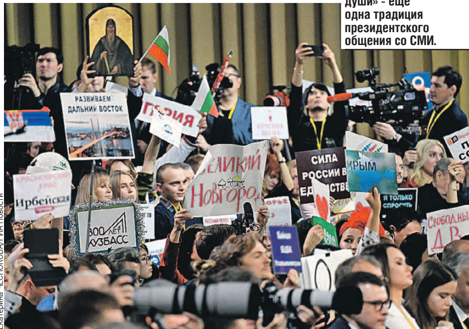
Таблички с названиями городов и «криками души» - еще одна традиция президентского общения со СМИ.

По России средневзвешенная цена на газ - 70 долларов за тысячу кубов. При этом чем дальше от мест добычи, тем больше мы дотируем эту цену. В Смоленске дотирование самое высокое. Но регион потребляет два миллиарда примерно. А в Беларусь мы продаем 20 миллиардов. Если будем дотировать весь этот объем, значит, Россия дотирует целиком белорусскую