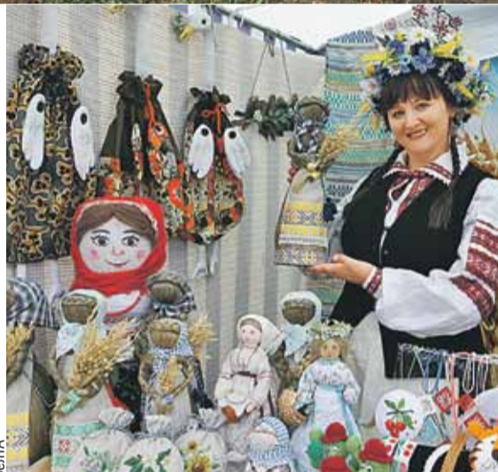
Для благополучия в доме и везения в личной жизни - льняные обереги!

Излюбленная забава на Дожинках - беспроигрышная лотерея. В качестве призов не только глиняные кубки и сувениры из льна, но и весьма солидные позиции вроде живых поросенка или телят. Участвовать будем?