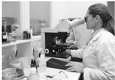
Руководство белорусского Минздрава и Федеральной службы

Беларусь и Россия создадут центр по определению качества продукции.