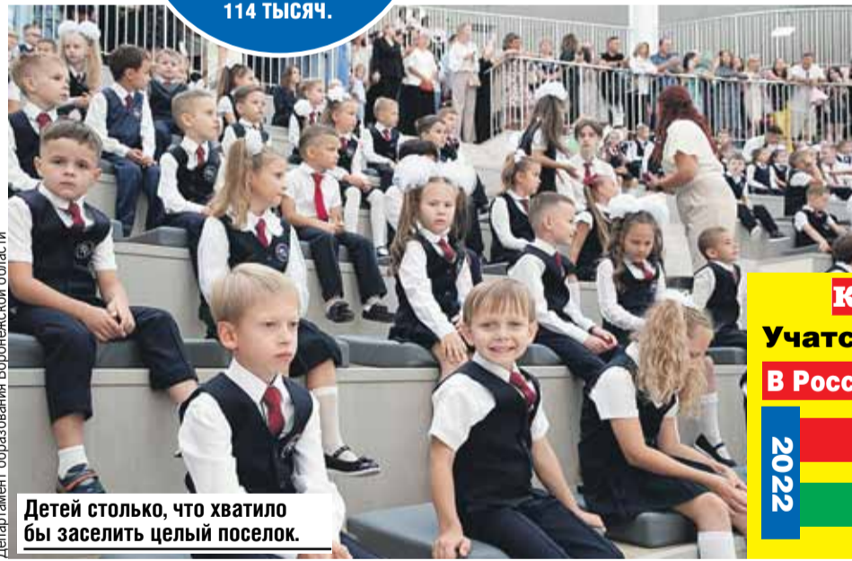
Детей столько, что хватило бы заселить целый поселок.

Построили ее за два года. Аналогов в Союзном государстве просто нет, и не только из-за размеров. Три тысячи учеников и 110 классов. Буквы каждому присвоили не просто так, а с расшифровкой, которая ко многому обязывает. «У» - значит умный. «Т» - творческий, «К» - креативный, «С» - солнечный, «Ц» - целеустремленный.