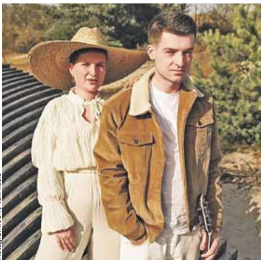
Ребята из группы VAL исполняют душевную композицию на мове.

в нем об успехах или навыках, которые удалось освоить на самоизоляции. Присылать ролики могут и российские, и белорусские ребята. Отправить можно в «Инстаграм» или телеграм-аккаунт: @hrusha_klass. Самые интересные видеорассказы покажут в эфире «Спокойной ночи, малыши!» на канале «Карусель».