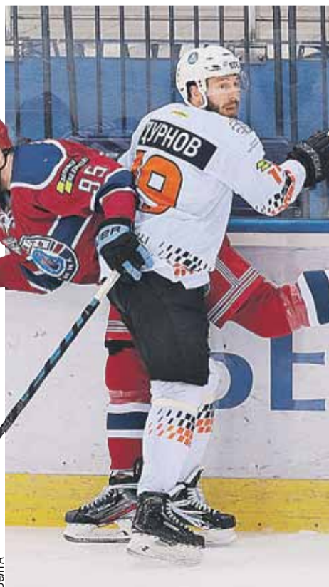
Минский клуб не оставил соперникам шансов на победу.

Легионеров в Гродно нынче пятеро: четыре финна и один россиянин - 27-летний уроженец Омска форвард