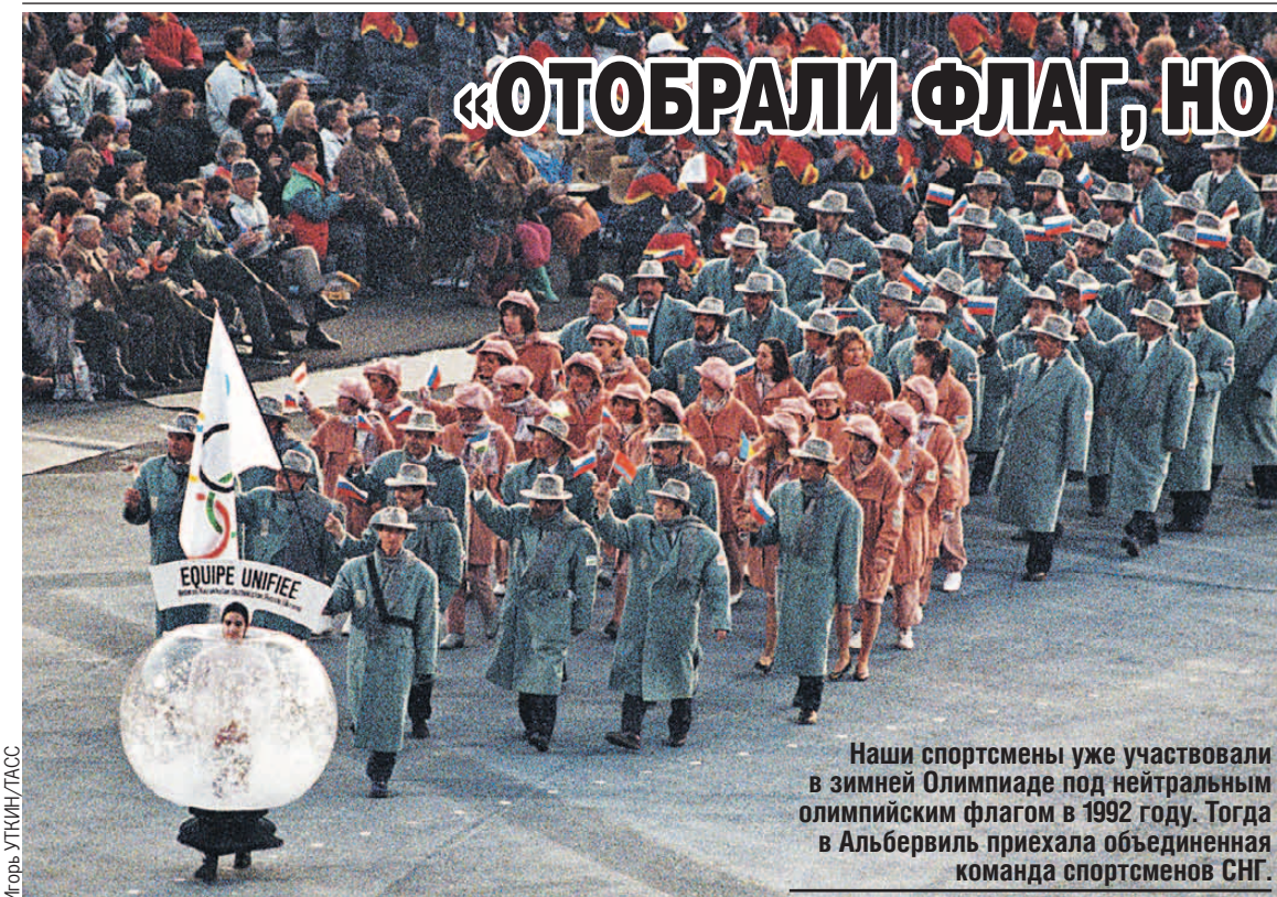
Наши спортсмены уже участвовали в зимней Олимпиаде под нейтральным олимпийским флагом в 1992 году. Тогда в Альбервиле приехала объединенная команда спортсменов СНГ.