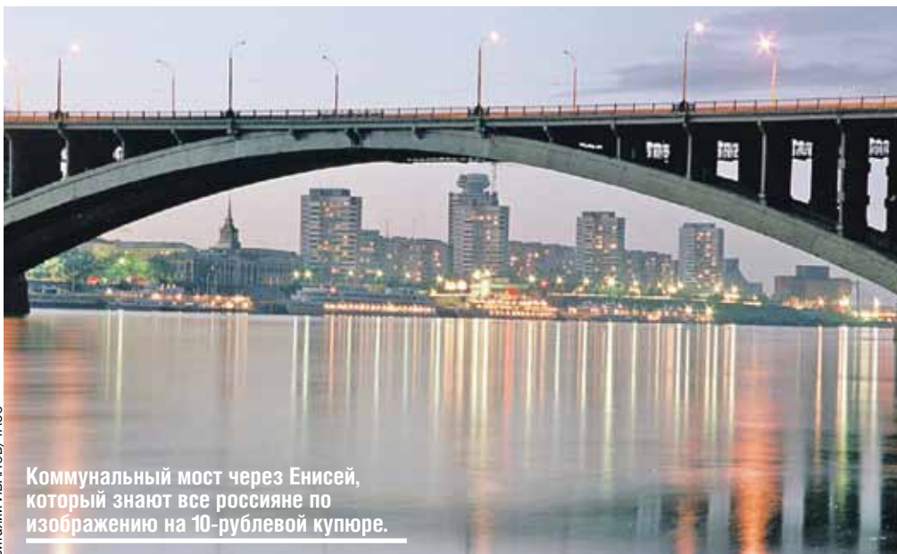
Коммунальный мост через Енисей, который знают все россияне по изображению на 10-рублевой купюре.

В Сибири многие по нашим меркам большие вроде бы реки, масштабом с Москву-реку или Неман, называют ручьями. На первый взгляд несправедливо так называть, но, когда видишь Енисей, понимаешь, что да - ручьи. Красноярск построен по понятным причинам на достаточно узком участке, здесь ширина русла лишь немного превышает полкилометра. Но стоит лишь пройти повыше, к Дудинке, а там - и к Усть-Порту, и вы с середины фарватера уже не увидите берегов, одни горы. Средняя ширина реки здесь составляет 5 км.