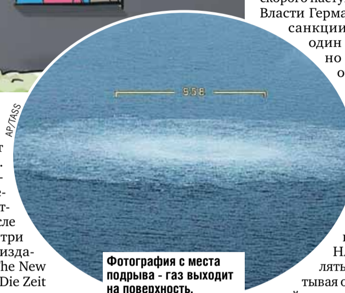
Фотография с места подрыва - газ выходит на поверхность.

А Мария Захарова заверила, что «Москва доведет расследование до конца». В конце концов, в этом заинтересован весь мир.