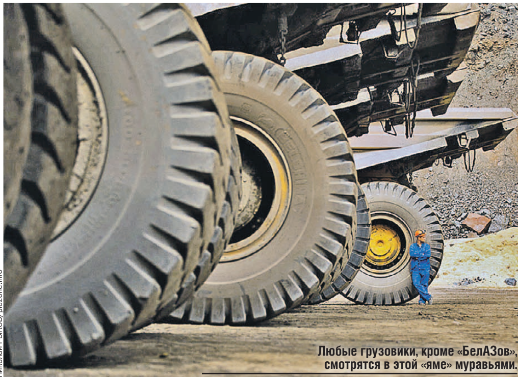
Любые грузовики, кроме «БелАЗов», смотрятся в этой «яме» муравьями.

Одно из самых примечательных зданий Старого Оскола - бывший дом купца Лихущина на улице Ленина, где сейчас расположен Краеведческий музей. В первую очередь бросается в глаза покрытая бронзовой чешуей-черепицей башенка необычной формы. Есть в ней секрет - подует ветер, и сверху льется мелодия. Все дело в особом ветряке с музыкальным ящиком. Это и сейчас диковинка, а представьте, какой эффект был в конце XIX века.