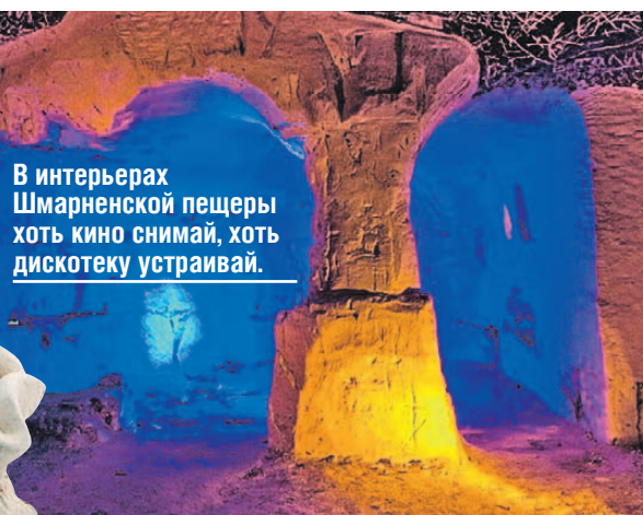
В интерьерах Шмарненской пещеры хоть кино снимай, хоть дискотеку устраивай.

Побывать в этом циклопическом мире и даже спуститься в сам карьер можно, записавшись на экскурсию. Проводят их по предварительной договоренности и только для групп.