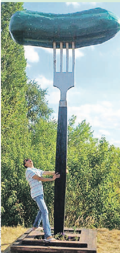
Проверено: селфи с гигантским огурцом в соцсетях собирают больше всего лайков.

Сегодня в цеха можно отправиться на экскурсию и своими глазами увидеть место, где появился на свет легендарный ирис «Золотой ключик». И не пытайтесь держать себя в руках в фирменном магазине - все равно не получится.