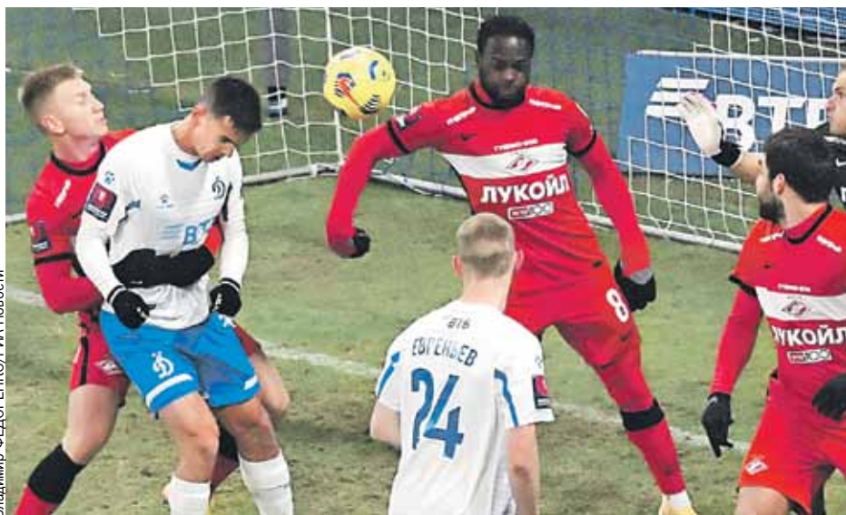
Вот тот самый спорный момент в матче «Спартак»-«Динамо». На одних фотографиях мяч, и это четко видно, попадет выше черной полосы на футболке Мозеса. На вызвавшем скандал скриншоте он как бы съехал ниже.

Навалились, что называется, всем миром. Почти пятьдесят миллионов клубу из своих закромов выделила РПЛ, остальную сумму для по-