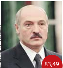
Александр Лукашенко 5 095 156 человек