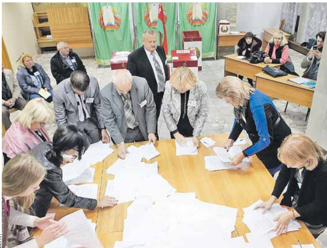
Как ни считай, а у Александра Лукашенко больше всех голосов избирателей.

Что стоит за признанием Западом выборов в Беларуси