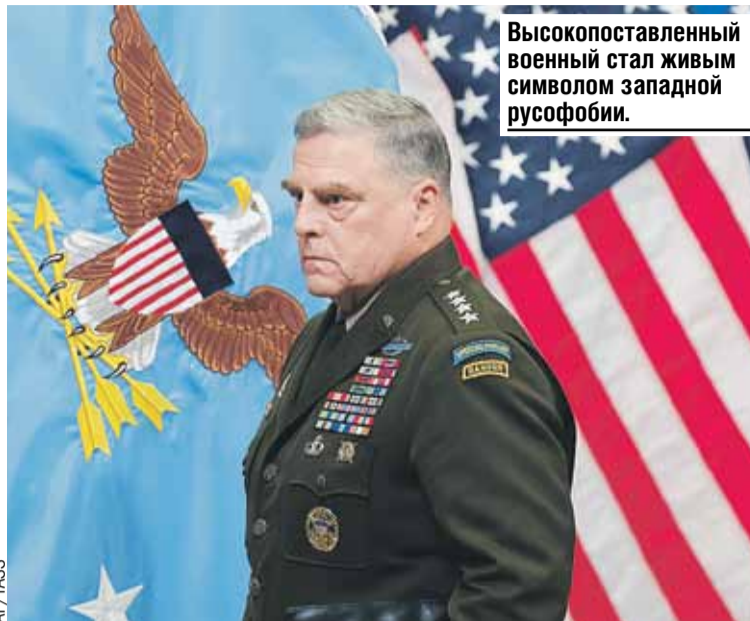
Высокопоставленный военный стал живым символом западной русофобии.

По поводу тревожного сна русских генерал блеснул красноречием во время пребывания в немецком Висбадене. Он обращался к украинским спецназовцам, которые проходили обучение по курсам зеленых беретов. Вот уж