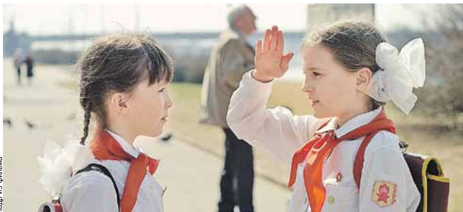
Раньше у пионеров был пример. Когда повзрослели - герои исчезли.