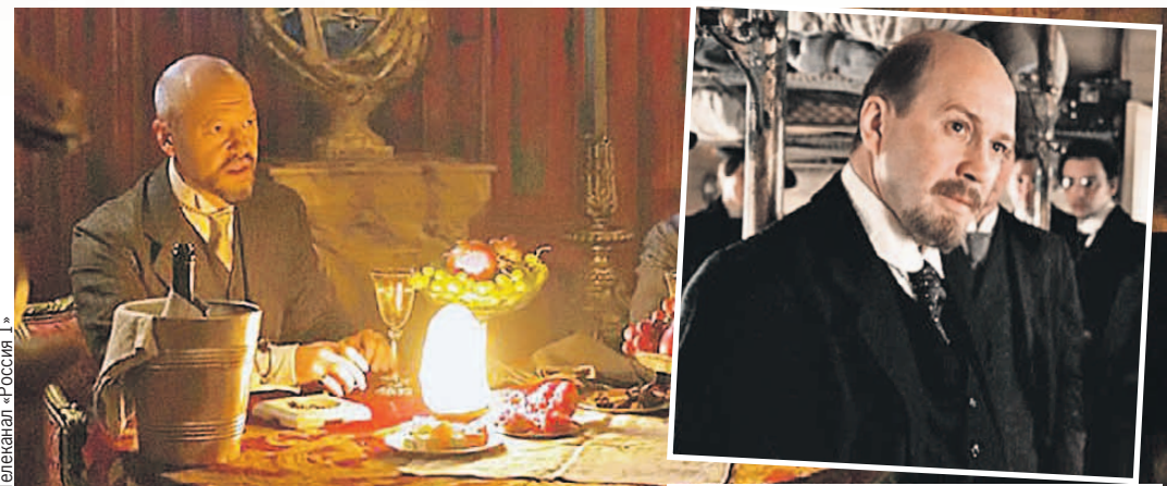
У Федора Бондарчука (слева) обнаружилось поразительное портретное сходство с Александром Парвусом. А без Евгения Миронова в роли Ленина режиссер вообще бы этот фильм снимать не стал.