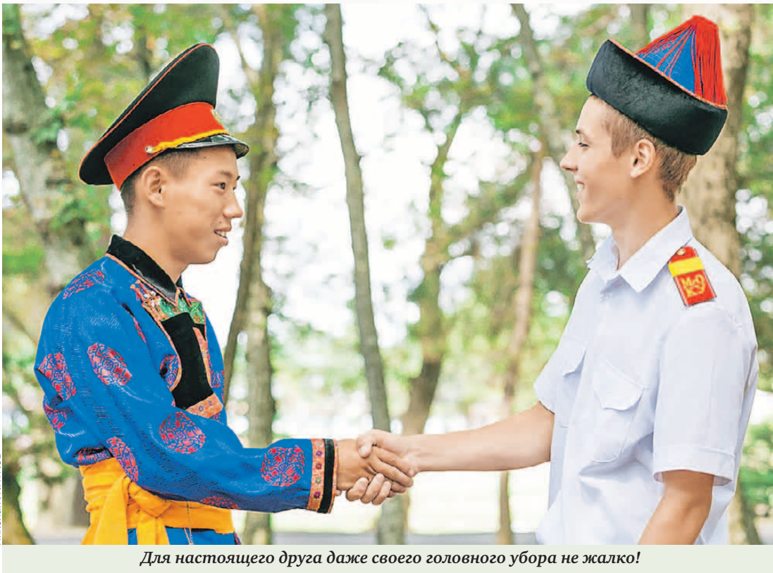
Для настоящего друга даже своего головного убора не жалко!